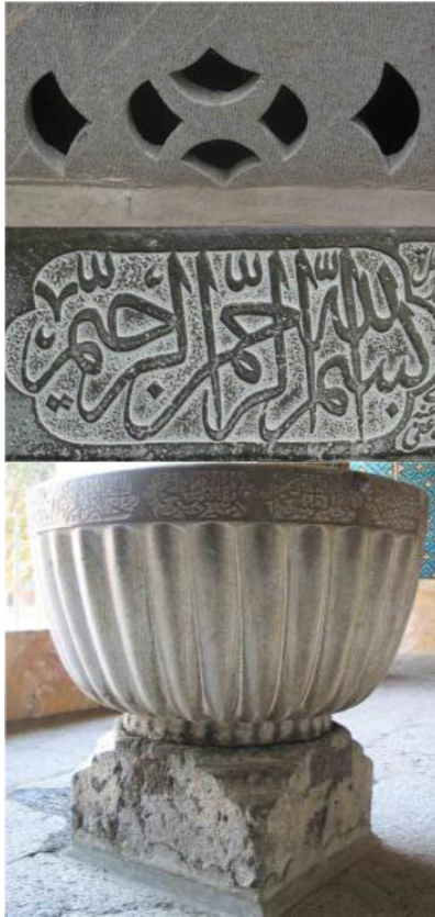
تصاویر ۸، ۹ و ۱۰: شبکه، حجاری و نقاشی و طلااندازی، مدرسه چهارباغ

فقط بر عقل و استدلال عقلی مبتنی است. فلسفه مشاء توسط ارسطو پایه‌گذاری گردید و بعدها توسط ابن سینا و فارابی تکمیل و گسترده گردید. ابن سینا را نماینده و رئیس فیلسوفان مسلمان مشائی و خواجه نصیر طوسی را احیاگر فلسفه مشاء خوانده‌اند. تفاوت اصلی فلسفه مشاء با فلسفه اشراق و حکمت متعالیه را در روش آن دانسته‌اند. در فلسفه مشاء، فقط از عقل و استدلال عقلی استفاده می‌شود، اما در فلسفه اشراق علاوه بر استدلال عقلی، از شهود و اشراق برای کشف حقایق استفاده می‌شود و در حکمت متعالیه، در کنار عقل و اشراق، از منابع عرفانی و وحیانی نیز استفاده می‌شود. ناگفته نماند فلسفه مشاء با منتقدانی از فلسفه و متکلمانی همچون ابوحامد غزالی، فخر رازی و شیخ اشراق روبه‌رو بوده است که سبب تکفیر ابن سینا و فارابی و غزالی در سه مسئله قدم عالم، انکار علم خدا به جزئیات و انکار معاد جسمانی شده است.