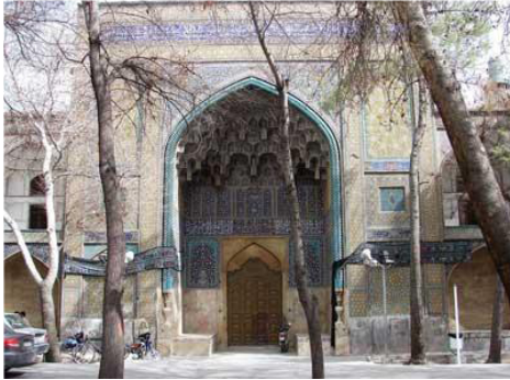
تصویر ۴: نمای سردر ورودی مدرسه چهارباغ

آرایه‌های کاشی‌کاری: تنوع فنون کاشی‌های بنا قابل توجه است. از جمله مهم‌ترین این فن‌ها، می‌توان به هفت رنگ، معرق، معقلی و کاشی فتیله اشاره نمود. با توجه به ایجاز این مقاله، در این قسمت از جزئیات کمی و کیفی بازتاب هر