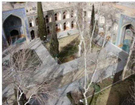
تصویر ۳: نمای صحن مدرسه چهارباغ

نمازخانه و مسجد: فضای مسجد در بنای چهارباغ، در دل ایوان جنوبی قرار گرفته و تماماً رو به قبله بنا شده است. دارای گنبدی از نوع نارگسسته و به شکل دوپوسته است. این گنبد از نظر تناسب معماری و زیبایی طرح کاشی‌کاری، بعد از گنبد مسجد شیخ لطف‌الله، دارای اهمیت بسیاری است. علاوه بر این، گنبدخانه با طرح هشت ضلعی، دارای محراب و منبر سنگی مرمرین شاخصی نیز است.