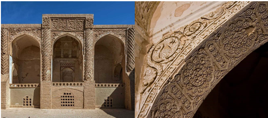
تصویر ۵: داخل مسجد