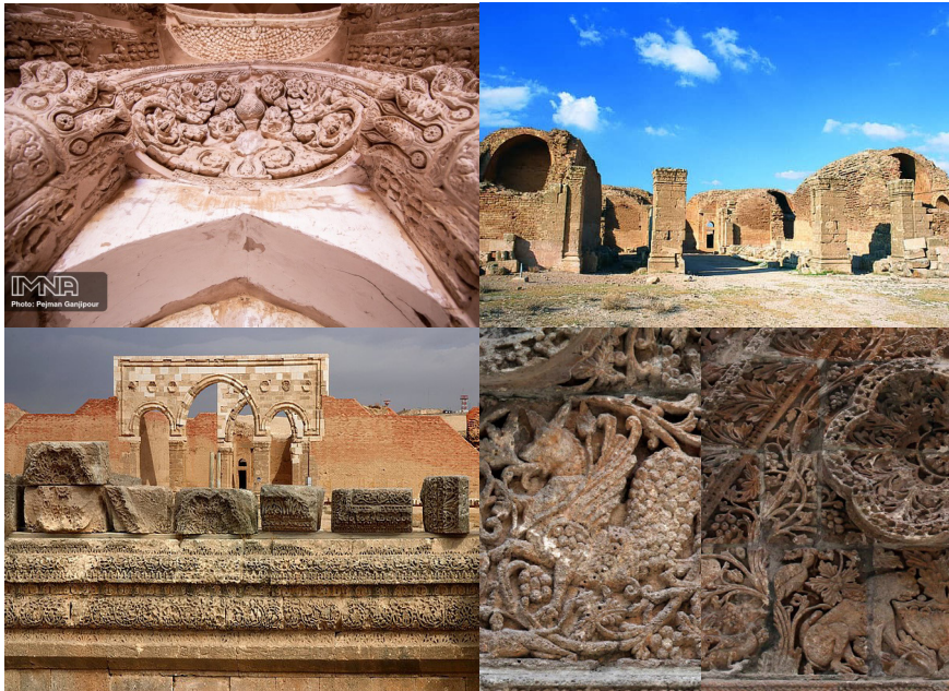
تصاویر ۸، ۹، ۱۰ و ۱۱: کاخ المشتی

برگ‌های تاک و خوشه‌های انگور در بنای قبة الصخره در کنار بهره‌گیری از فرم‌های مثلث و دایره در قصر المشتی و سایر نقوش به کاررفته، همه نشان از حضور معماری و هنر ایرانی در معماری دوره اموی و عباسی دارند. همچنین هم‌جواری جغرافیایی، تعلقات به آرمان‌های یکسان، زبان، هنر و شراکت در ایجاد و پرورش مکاتب علمی از دیگر دلایل انتقال نقوش از معماری و فرهنگ ایرانی به معماری دوره اسلامی به طور خاص دوره اموی و عباسی است.