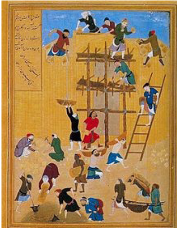
تصویر ۲: نسخه‌ای از خمسه نظامی، ۱۴۹۴-۱۴۹۵ م / ۸۹۰-۸۹۱ ق، کتابخانه ملی بریتانیا، لندن

به سمت آن‌ها حمل می‌کند و کارگری دیگر روی تلی از خاک آب می‌ریزد. گل‌ها توسط یک کارگر سیاه‌پوست در ناهای حمل شده و از طریق نردبان به قسمت بالا منتقل می‌شود. در سمت راست پایین، دو کارگر زنبه‌ای پر از آجر و خشت به سمت چپ حمل می‌کنند؛ جایی که دو کارگر با تیشه مشغول آن‌ها هستند. این خشت‌ها توسط کارگر با لباس قرمز که