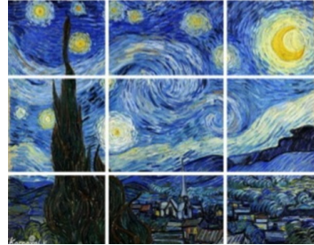
تصاویر ۷ و ۸

هم‌سو کردن نیروهای متضاد سطح تصویر با اعطای عناصر مشترک به همه آن‌ها حاصل می‌گردد. به عبارتی، کیفیت پیوند عناصر بصری در یک ترکیب‌بندی است (اوکوپرک و دیگران، ۱۳۹۷: ۵۴-۵۶). تصویر تجسمی تمام خصوصیات یک ارگانیزم زنده را دارد و در نتیجه، عمل متقابل نیروهایی که در میدان‌های مربوطه خود عمل می‌کنند و به این میدان‌ها مشروط هستند، به وجود می‌آید (کیس، ۱۳۹۸: ۱۹).