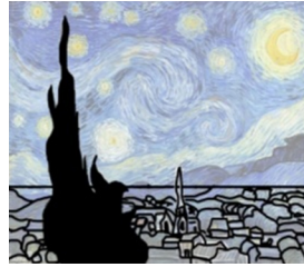
تصاویر ۵ و ۶