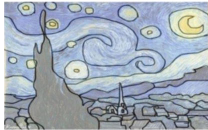
تصاویر ۳ و ۴

وجود ساختار دودویی نور و سایه، تفرق و اتصال، سکون و حرکت، شفافیت و کدري، زبری و نرمی، تشابه و اختلاف در ادراک شناخت گونه، به صورت کیفیت تضاد فهم می‌شود. «در روند سازماندهی بصری، کنتراست نیروی حیاتی در خلق یک کل منسجم است. در تمام هنرها، کنتراست ابزار نیرومندی برای بیان و تقویت معنی و موجب سادگی و سهولت ارتباط است. بدون کنتراست ذهن به سمت از بین بردن تمام حواس و به وجود آمدن جو زوال و نابودی پیش می‌رود. آرامش و تعادل مطلق مانند محیطی است که در آن نه رنگی دیده