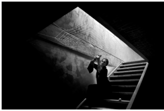
تصویر ۵: پروژه شاپرک خانوم، (URL3)

در تصویر ۴، زنان همگی در سایه و تاریکی، در مقابل روزنه‌های نور، تار می‌تندند. آن‌ها در حکم شاپرک‌هایی هستند که تور عنکبوت اسیر و گرفتار شده‌اند و راهی برای رهایی باید پیدا کنند. سیاه و سفید بودن عکس دلالت بر ناامیدی سوژه دارد.