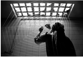
تصویر ۴: پروژه شاپرک خانوم، (URL3)

در پی وعده‌ای که با آفتاب دارد، در جست‌وجوی راه خروج و رسیدن به نور در تار عنکبوت گرفتار می‌شود و عنکبوت که با دیدن زیبایی و ظرافت شاپرک خانوم، دلش به رحم آمده و با شاپرک خانوم قرار می‌گذارد که یکی از حشرات داخل انباری تاریک را برایش بیاورد و در تارهای تنیده‌اش گرفتار کند تا راه خروج و رسیدن به نور را نشان دهد، اما شاپرک خانوم هر بار بعد از شنیدن درد دل حشرات دلش می‌سوزد و در نهایت، دست خالی با بال‌های خراشیده نزد عنکبوت بازمی‌گردد و خود را در تار می‌اندازد تا غذای او شود. عنکبوت که از ماجرا خبر دارد دست‌های شاپرک خانوم را از تارها، رها می‌کند و راه خروج را به او نشان می‌دهد تا به وعده دیدارش با آفتاب برسد. شاپرک خانوم حشرات را فرامی‌خواند تا آن‌ها نیز در این آزادی سهمی داشته باشند، اما هیچ پاسخی نمی‌شنود. شاپرک خانوم، مأیوس از رفتار حشرات دیگر، بال‌های خسته‌اش را باز می‌کند و به سمت نور می‌رود (خاوری، ۱۳۸۹: ۱۸).