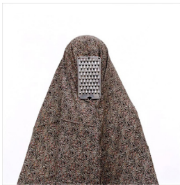
تصویر ۳: پروژه مثل هر روز، (URL3)

در تصویر ۲، شمایل چهره زن قابل مشاهده نیست. پس نمی‌توان به لذت‌ها، آرمان‌ها و اشتیاق او درباره زندگی پی برد. آنچه اهمیت دارد، اشیاء روی صورت است.