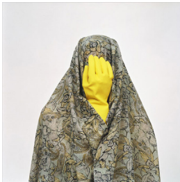
تصویر ۲: پروژه مثل هر روز، (URL3)

در تصویر ۱، یک زن با چادر طرح‌دار پوشانده شده است. از سر تا نیم‌تنه‌اش در مرکز کادر قرار دارد و یک فنجان قرمز با نعلبکی مقابل صورتش است. فارغ از اینکه آن زن در کجای دنیا زندگی می‌کند و چه فعالیت‌هایی دارد، آنچه در این اثر حائز اهمیت است، همه فهم بودن آن است. برای مثال، فرقی نمی‌کند این زن ایرانی باشد یا امریکایی و فرانسوی، هر زنی در هر جای دنیا، دغدغه‌های مربوط به خانه‌داری و نگرانی فرزندان را دارد.