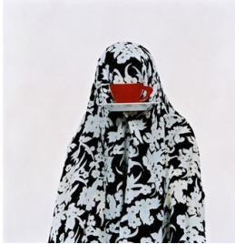
تصویر ۱: پروژه مثل هر روز، (URL3)

در تصویر ۱، یک زن با چادر طرح‌دار پوشانده شده است. از سر تا نیم‌تنه‌اش در مرکز کادر قرار دارد و یک فنجان قرمز با نعلبکی مقابل صورتش است. فارغ از اینکه آن زن در کجای دنیا زندگی می‌کند و چه فعالیت‌هایی دارد، آنچه در این اثر حائز اهمیت است، همه فهم بودن آن است. برای مثال، فرقی نمی‌کند این زن ایرانی باشد یا امریکایی و فرانسوی، هر زنی در هر جای دنیا، دغدغه‌های مربوط به خانه‌داری و نگرانی فرزندان را دارد.