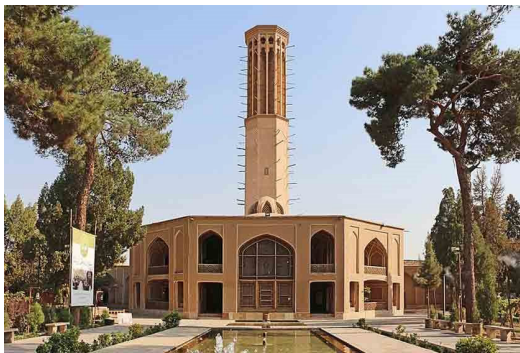
تصویر ۱: نمایی از بادگیر باغ، (URL 1)

«هشت باغ دولت آباد» که به اختصار «باغ دولت آباد» نامیده می‌شود، از مجموعه‌های مشهور دوره زندیه می‌باشد که قدمت ساخت آن به سال ۱۱۶۰ هجری قمری بازمی‌گردد. این باغ به دستور محمد تقی خان بافقی، حکمران و والی یزد ساخته شد. باغ دولت آباد یکی از زیباترین باغ‌های ایران به شمار می‌رود که در وسعتی در حدود ۶,۴ هکتار احداث شده است. در زمان محمد تقی خان، باغ از سمت شمال به خیابانی می‌رسید که درختان بسیاری داشت؛ به طوری که این درختان، مانع دید از خارج به داخل باغ می‌شدند. به این سبب، این خیابان را «هزار درخت» نیز می‌گفتند که عرض ۴ تا ۵ متر و طولی بیش از ۲۰ کیلومتر داشت و به سمت رحیم آباد می‌رفت. در سمت شرق باغ نیز خیابانی به طول ۸ کیلومتر قرار داشت و از سمت غرب باغ به مسیر رودخانه خشک محدود می‌شد. در این زمان، باغ خارج از حصار شهر یزد قرار داشت. با گسترش یافتن شهر، این باغ در دوران قاجاریه متصل به دروازه «چهار منار» اما همچنان خارج شهر قرار می‌گرفت، اما با گذشت زمان، بافت شهری اطراف آن را پر کرد؛ به طوری که در دوران پهلوی ساخت و ساز حومه شهری پیرامون آن را فرا گرفت و به تدریج باغ در مرکز شهر یزد قرار گرفت (جواهریان، ۱۳۸۳: ۱۰۱).