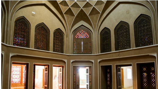
تصویر ۲: نمایی از عمارت هشتی

اصطبل‌بزرگ با شترخانه و غلام‌خانه در غرب باغ و در کنار رودخانه خشک قرار دارد. عناصر و اجزای باغ عبارتند از: عمارت سردر (بهشت آئین)، عمارت هشتی (عمارت بادگیر)، تالار طنبی، عمارت طهرانی، تالار آینه، عمارت سردر شمالی، اصطبل بزرگ، ابنیه فرعی و خدماتی و آب انبار.