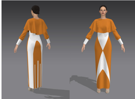
تصاویر ۱۰ و ۱۱: لباس با الهام از بادگیر