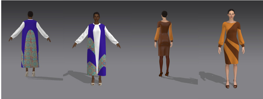
تصاویر ۸ و ۹: لباس با ایده از ارسی‌ها