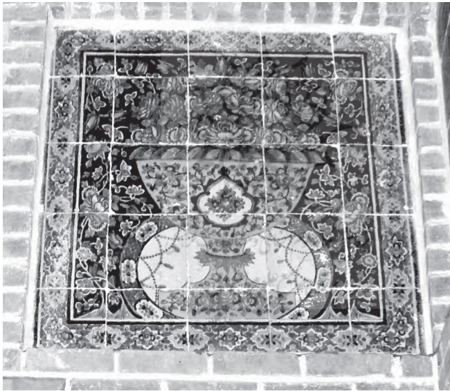
تصویر ۱: نقش کاسه بشقاب مسجد و مدرسه شیخ عبدالحسین، (بمانیان، مؤمنی و سلطان‌زاده، ۱۳۹۰: ۴۵)

آن دو به‌وسیله در آهنینی مسدود شده است و هم‌اکنون ارتباطی بین آن دو وجود ندارد و امورات و برنامه‌های مسجد در دست کسبه بازار است و مسجدی توسط حضرت آیت‌الله سیدهادی خسروشاهی در سال ۱۳۶۸ ش برای اقامه نماز طلاب در حیاط مدرسه احداث گردید.