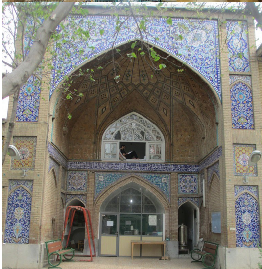
تصویر ۴: ایوان شرقی مدرسه شیخ عبدالحسین تهرانی