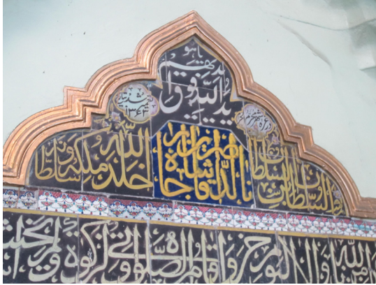
تصویر ۷: کتیبه سر در مسجد شیخ عبدالحسین