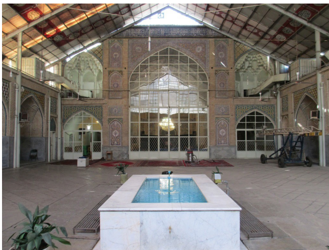
تصویر ۲: نمای بیرونی مسجد شیخ عبدالحسین